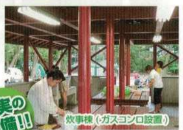
炊事棟 (ガスコンロ設置)