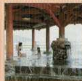
ゆアシス東郷 龍鳳閣