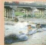
三朝温泉 河原風呂