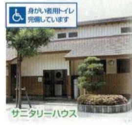
サニタリーハウス